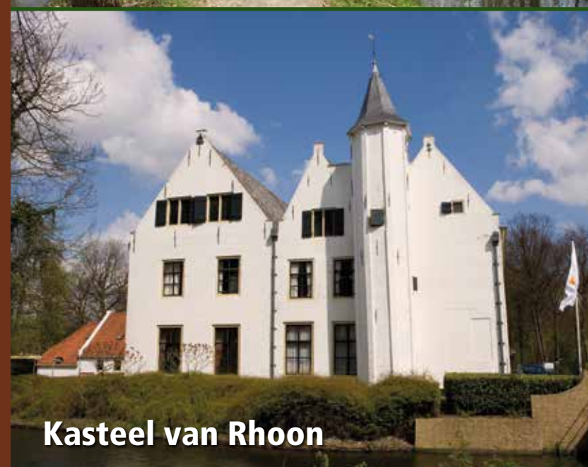
Kasteel van Rhoon