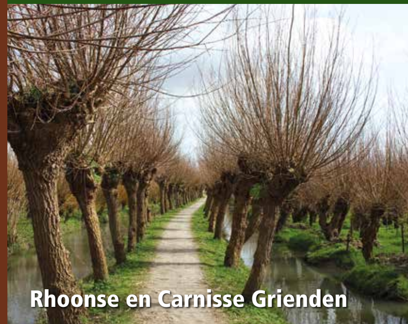
Rhoonse en Carnisse Grienden