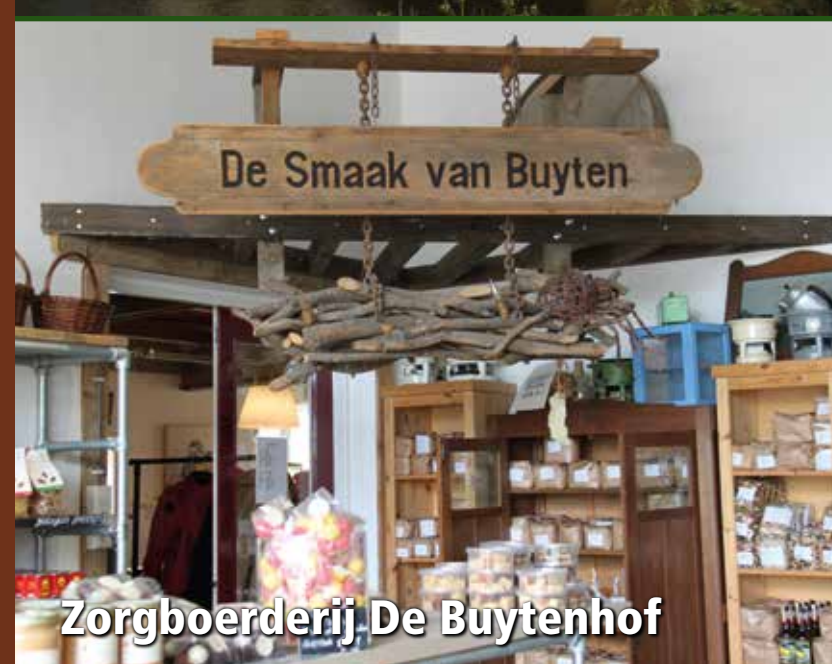
Zorgboerderij De Buytenhof